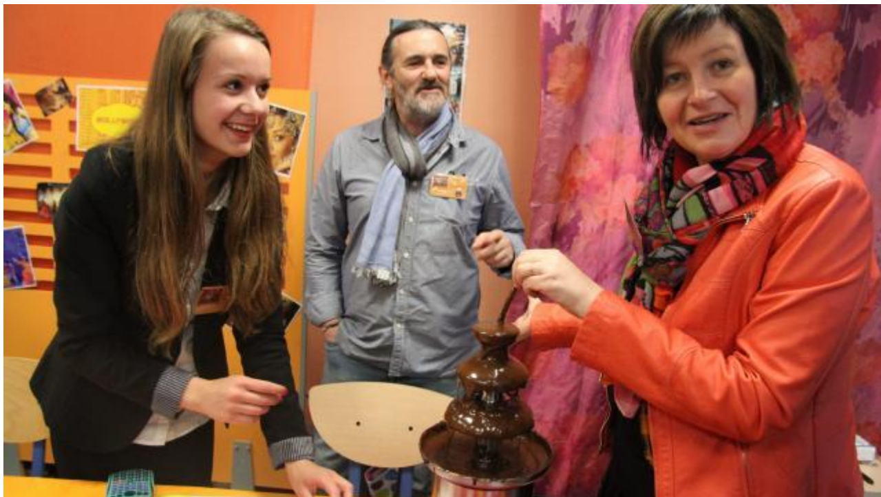
La fontaine à chocolat de l'EEP Fête et Caf, du lycée Simone-Signoret à Bressuire, a connu un grand succès