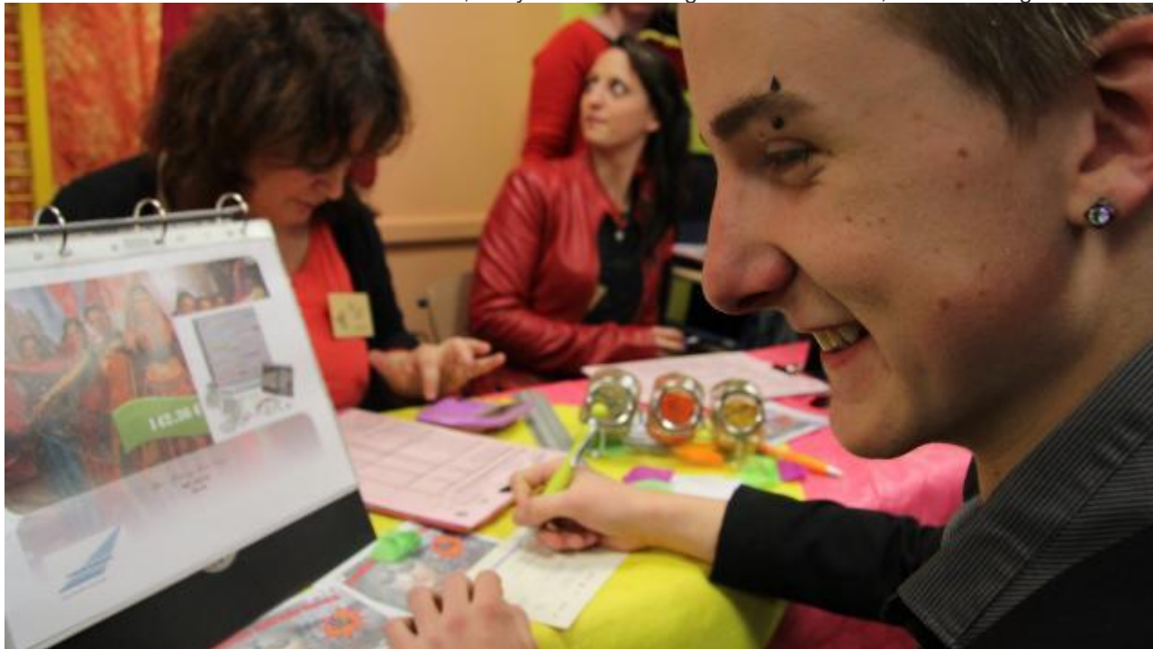
Un lycéen de Blaise-Pascal qui s'apprête à dépenser une partie de ses mille euros virtuels.