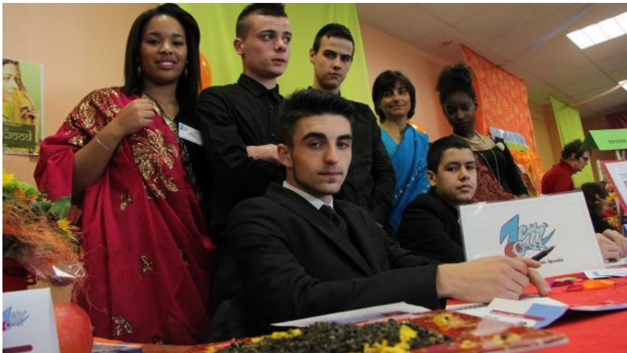
L'équipe au complet de l'EEP Zen Océan, de Bouguenais.